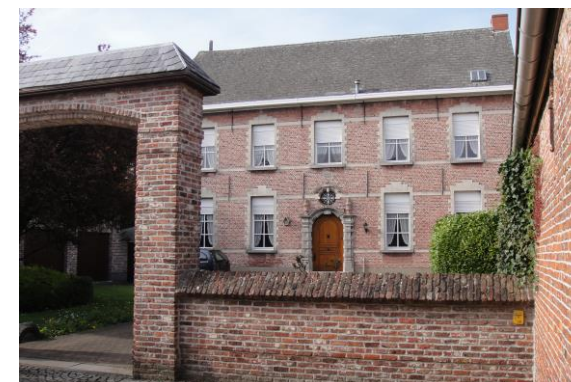
Genealogisch documentatiecentrum "De Oude Pastorie"